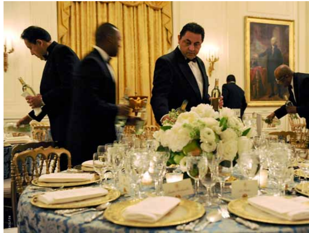
BARACK EN MICHELLE HOUDEN VAN EEN GOED GLAS WIJN